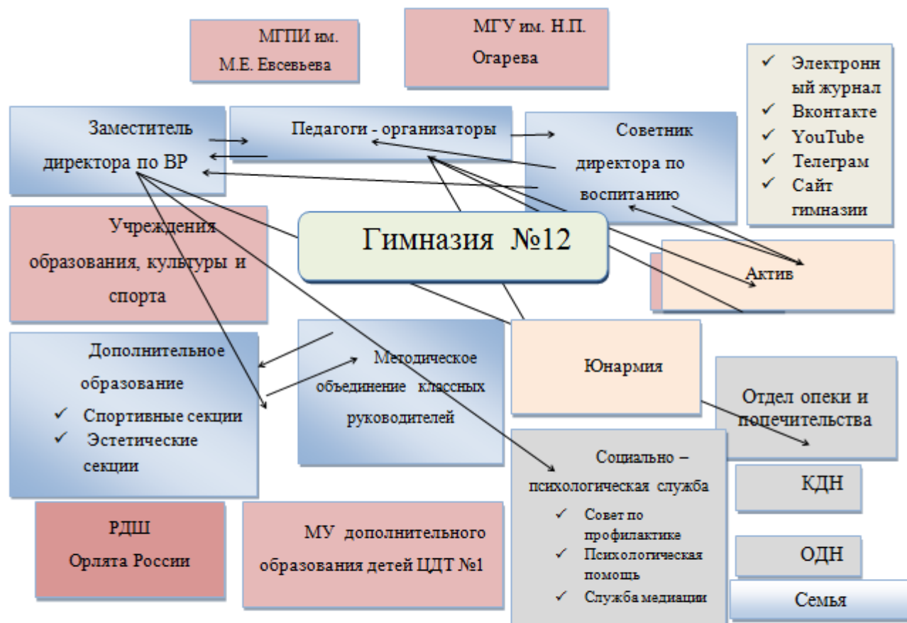
Рисунок 1 - Взаимодействие субъектов воспитательной работы в гимназии №12

родителями, а также с внешними социальными структурами для оказания реальной, квалифицированной, всесторонней и своевременной помощи детям и учителям по защите их личностных прав и предупреждения их нарушения (рис.1)